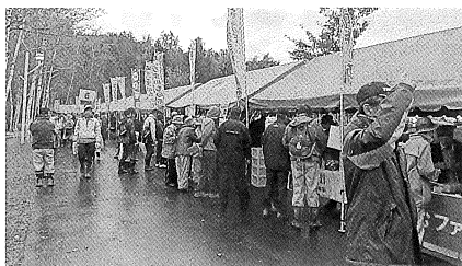
北のうまいもの市会場

十月四日に、和寒町の三笠山自然公園ふれあいのりに於いて、「第三回北のうまいもの市」が開催されました。この催しは、一市三町の商工会議所、商工会で連携を図り行っている事業で、各地域の特産品を知ってもらおうと会場では、「士別市のラム串」、「朝日町の笹寿司」、「剣淵町のトマトジュース」、「和寒町のペポタルト」、「幌加内町のそば」等の販売に多くの人達が列を作っていました。