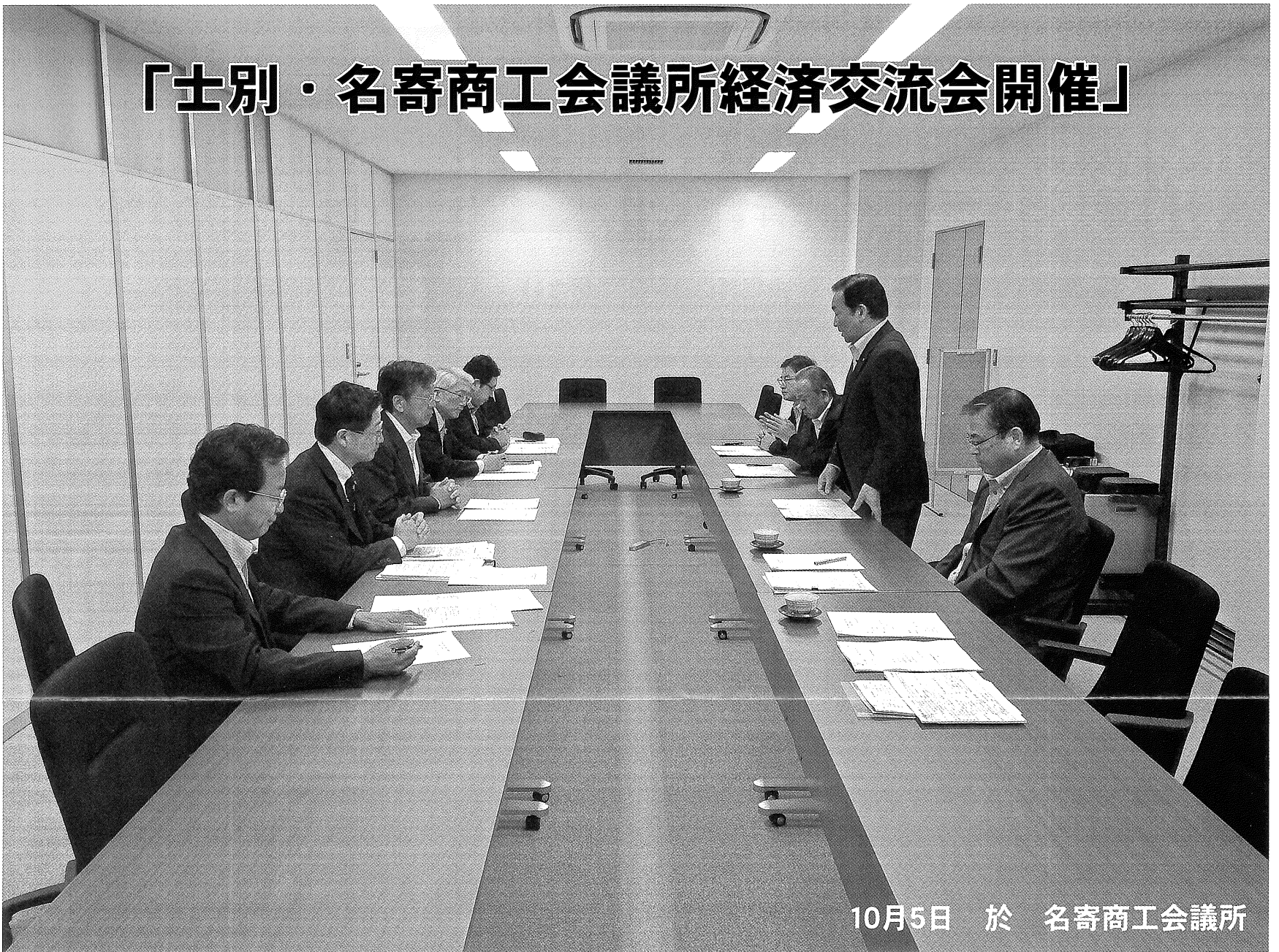
10月5日 於 名寄商工会議所