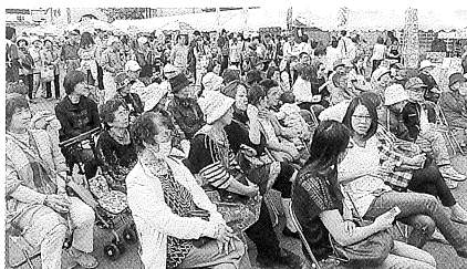
大勢の市民で賑わう会場

九月二十六日、北星信用金庫士別中央営業部駐車場に於いて、中心市街地の活性化を目的に、今年二回目となる「にぎわい市場」が、士別市・士別商工会議所・士別市中心商店街振興組合・サフォークスタンプ協同組合・士別市卸売市場買受人組合士別支部で構成する実行委員会の主催で開催されました。会場には、市内の農業者が生産した玉ネギ、トマト、カボチャ、ジャガイモ等の新鮮な野菜をはじめ、生サンマ、新巻鮭、毛ガニ等の海産物まで秋の味覚が販売されました。又、中心商店街振興組合店舗で買物された方を対象とした、テレビや炊飯ジャー、灯油券、各組合店賞等の豪華賞品が当たる「レシート抽選会」等のイベントも行われた他、焼き鳥や焼きそば手打ちそば等の飲食コーナーが設けられ、秋の日差しの中、大勢の市民で、会場は終始にぎわいを魅せていました。